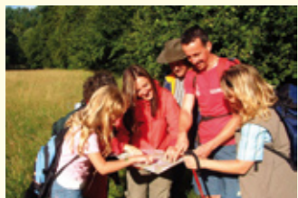
Immer auf dem richtigen Weg

Dem Grundsatz „Schutz durch Nutzung“ folgend hat es sich der Naturpark Lahn-Dill-Bergland zur Aufgabe gemacht, die landschaftliche Vielfalt und Schönheit der Region zu bewahren und für Gäste und Einheimische mit allen Sinnen erfahrbar zu machen.