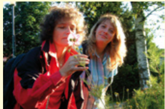
Kurpark Bad Endbach

Auf einer Strecke von 86 Kilometern führt diese Traumroute die Wanderer mitten durch den Naturpark Lahn-Dill-Bergland. Seit Kurzem gehört der zwischen den Flüssen Lahn und Dill gelegene und 87.432 Hektar große Naturpark Lahn-Dill-Bergland zu den 11 Naturparks in Hessen.