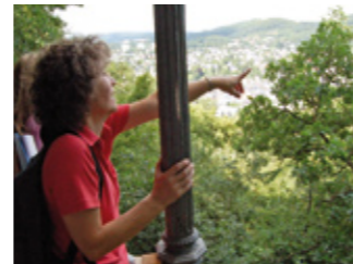
Am Jahntempel bei Herborn

Wildkräuter und Wiesenblumen säumen den Weg durch das Seiberts- häuser Wiesental. Mit einer unvermutet mitten im Wald auftauchenden Felslandschaft überraschen Kopps Klippen.